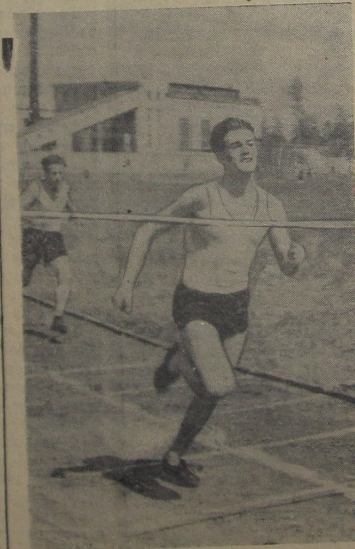
Эстафета на городском стадионе.