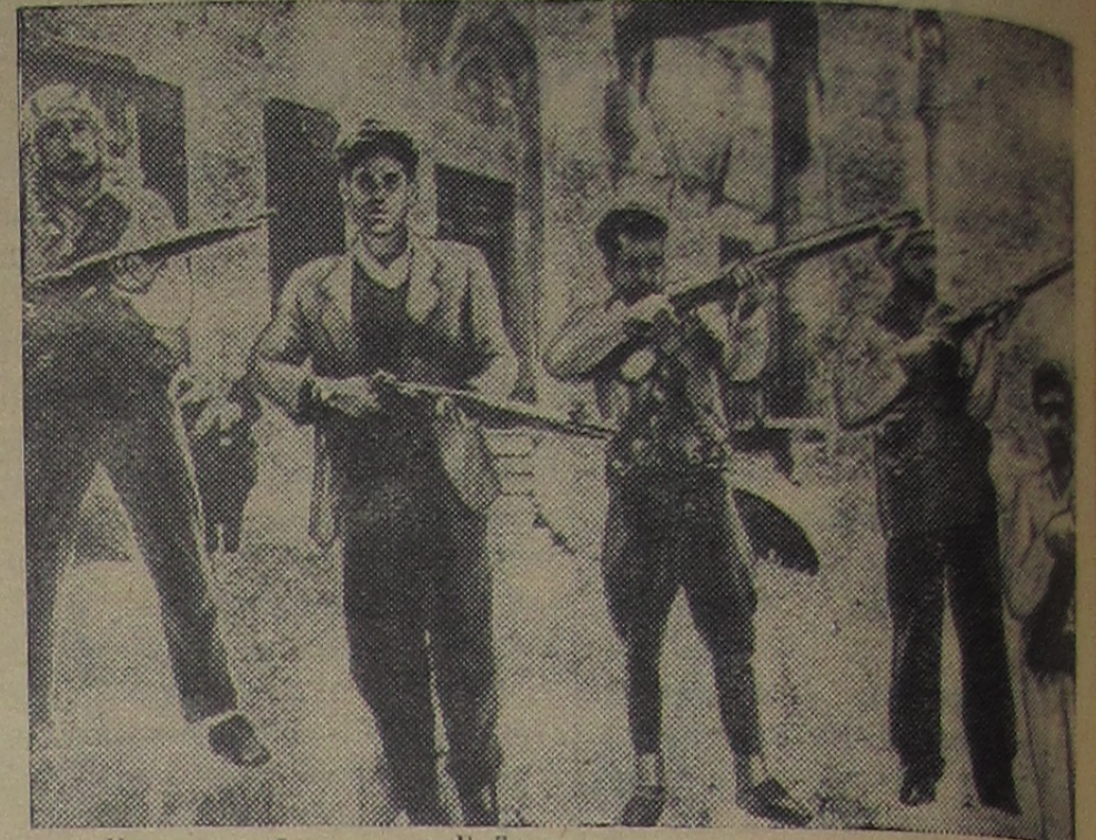
Повстанцы на улице Бейрута.