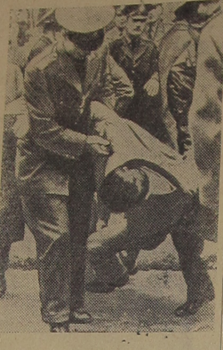
На снимке: полиция разгоняет демонстрантов.

Греция. Недавно студенты Афинского университета организовали демонстрацию в знак протеста против политики английского правительства в отношении Кипра. Во время разгона демонстрации полицией было ранено несколько человек.