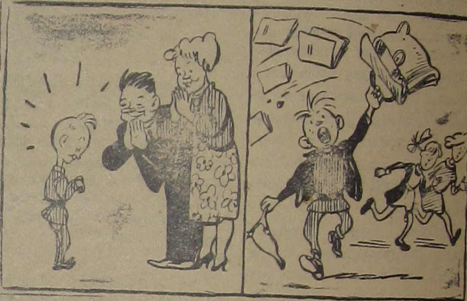
Рис. В. Жарнинова. Дома мальчик — пай, а на улице — шалопаи.