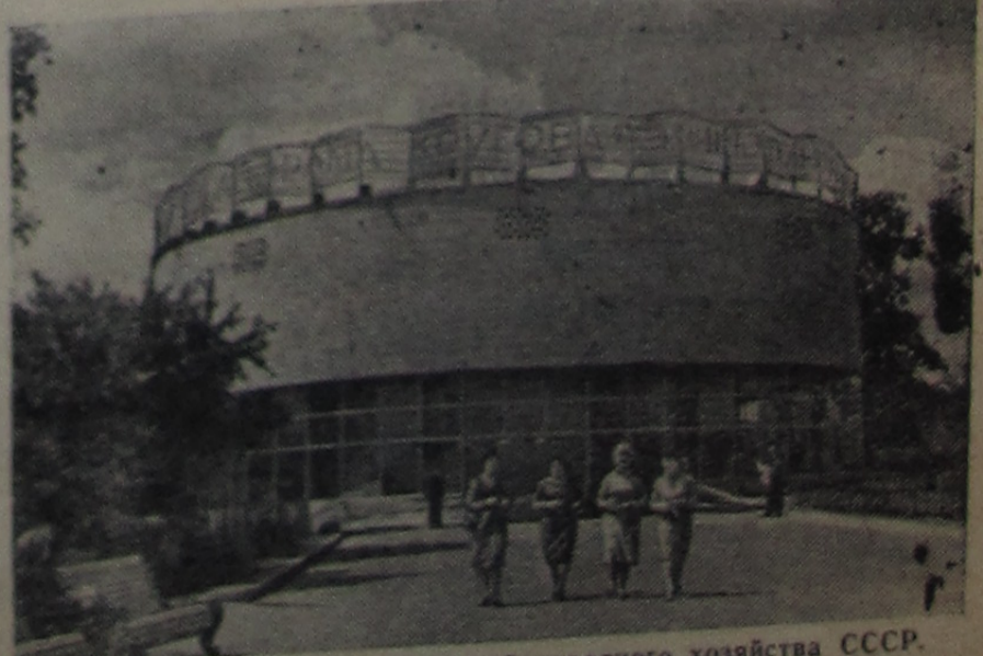
МОСКВА. Выставка достижений народного хозяйства СССР. Здание круговой киноопорамы.