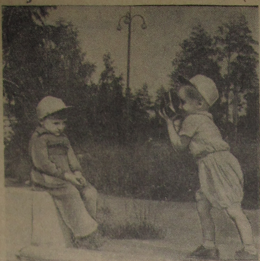
— Спокойно, снимаю!