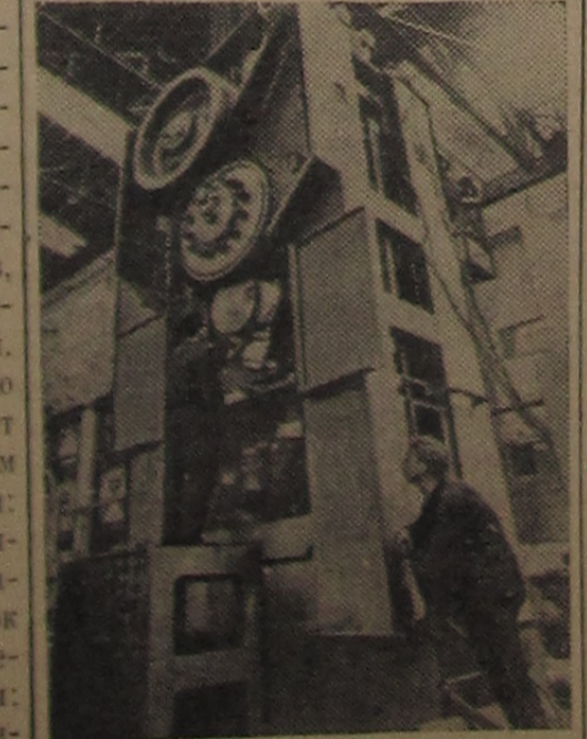
Чехословацкая Республика. На машиностроительном заводе имени Б. Шмерала в Брно сооружается вертикальный кузнечный пресс ЛКМ-1600, который будет выставлен на Первой международной ярмарке в сентябре 1959 года в Брно. На снимке: вертикальный кузнечный пресс.

Положение о комиссиях предоставляет им право вносить через парткомы или бюро первичных парторганизаций на обсуждение собраний рабочих и служащих вопросы по улучшению работы цеха, завода, предприятия, института, с целью мобилизации коллектива, на устранение недостатков, ставить отдельные вопросы на свои заседания для предварительного рассмотрения и выработки предложений. Комиссии обязаны настойчиво добиваться, чтобы решения, обсуждаемые ими вопросов, выполнялись полностью.