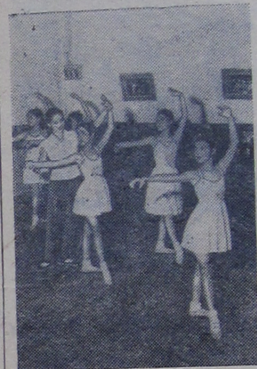
Китайская Народная Республика. На занятиях в балетной школе в Пекинском Дворце пионеров.

На основе советско-китайского Договора о дружбе, союзе и взаимной помощи успешно развиваются экономические, культурные и научно-технические связи между нашими странами. Помощь Советского Союза играет огромную роль в строительстве социализма в Китае.