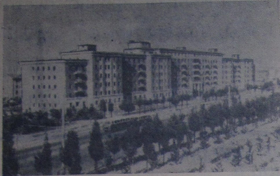
Китайская Народная Республика. Новый жилой дом в восточном пригороде Пекина.

К одиннадцатилетию со дня провозглашения Китайской Народной Республики