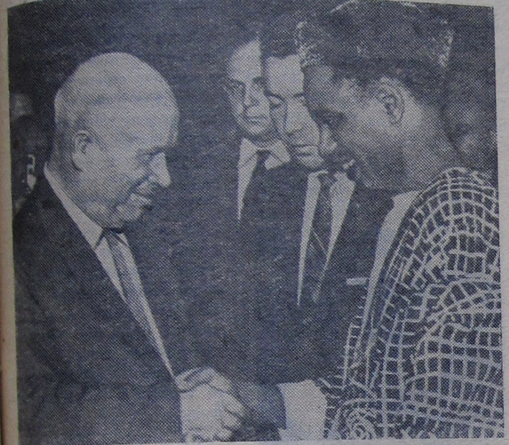
Нью-Йорк. XV сессия Генеральной Ассамблеи Организации Объединенных Наций. На снимке: глава делегации Советского Союза Н. С. Хрущев и делегат Гвинейской Республики Исмаил Туре в перерыве между заседаниями.