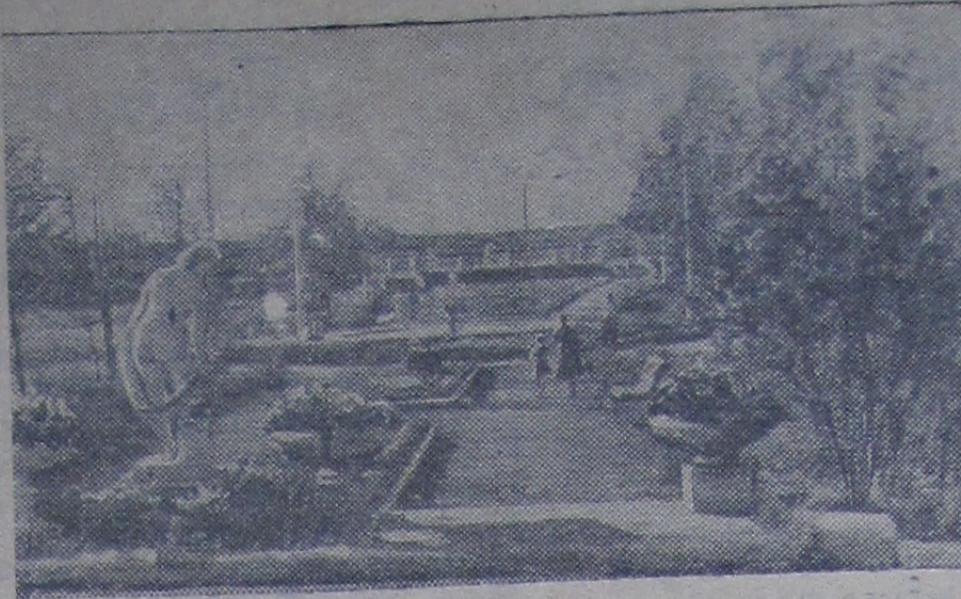
В дубненском парне.