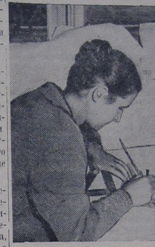
Отвечаем на вопросы читателей

По своей наивности я тоже решил ускорить процесс приобретения готовых порошков. Но, видимо, не произвел выгодного впечатления на девушку. Правда, пенициллин мне был отпущен, а