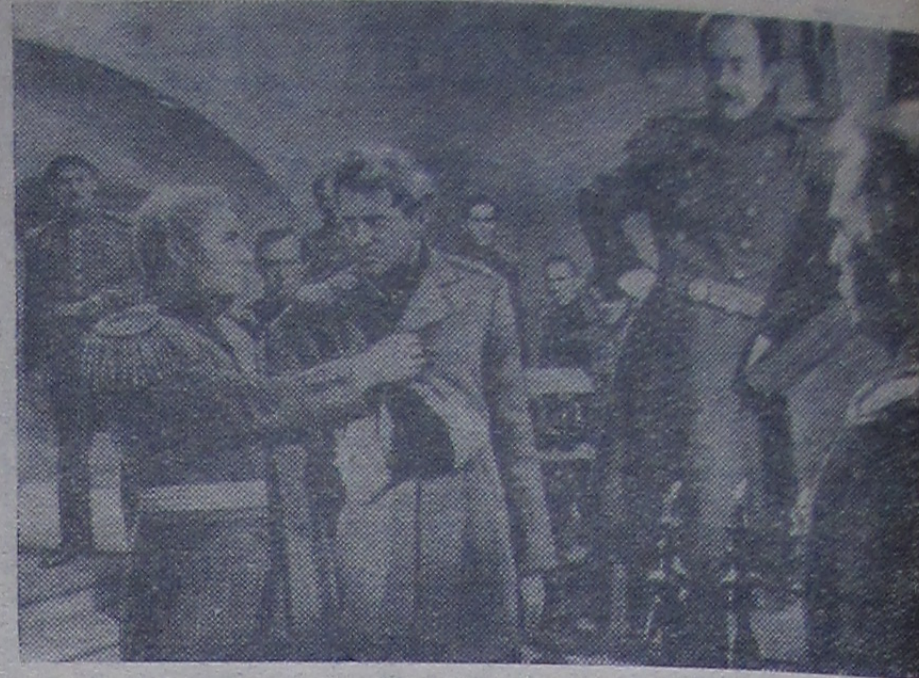
Кадр из кинофильма „Северная повесть“, поставленного режиссером Евгением Андриканисом на студии „Мосфильм“, по одноименной повести Константина Паустовского.

Художественный кинофильм „Ночь в сентябре“. Начало в 17, 19 и 21 час.