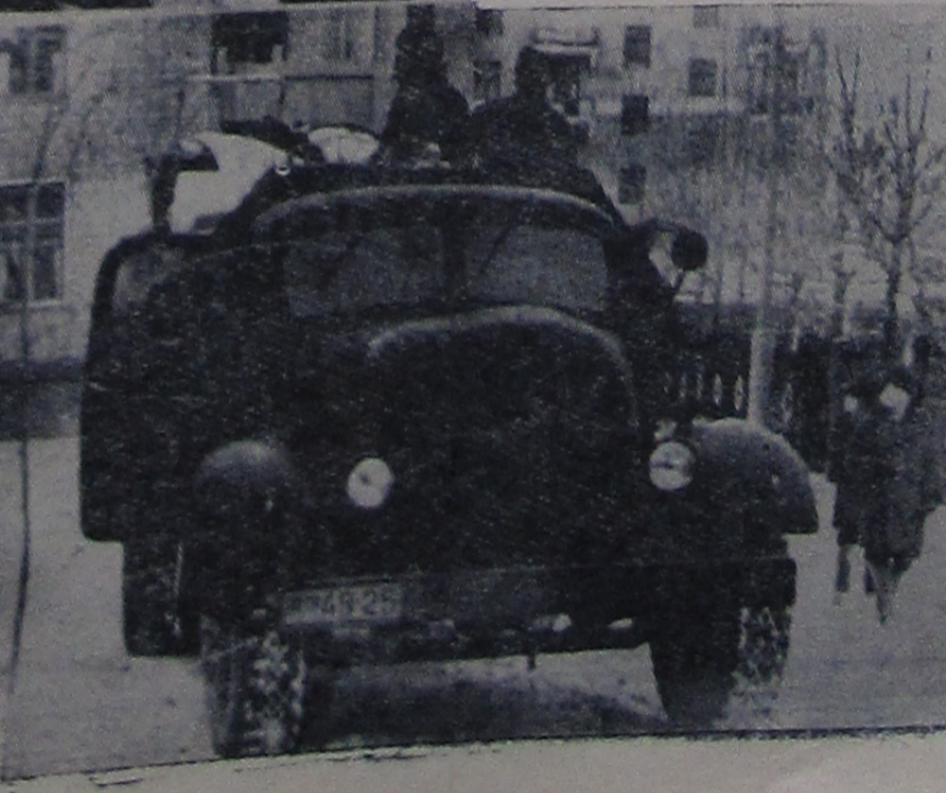
Сколько радости испытывает каждая семья, переступив порог чистой уютной квартиры пахнущей свежей краской! В снимках запечатлены новоселы г. Ивановки, переезжающие в новый восьмидесятиквартирный дом по Центральной улице.