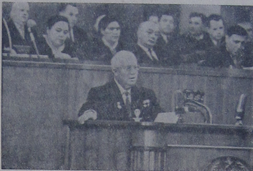
7 мая закончила свою работу пятая сессия Верховного Совета СССР. Советский парламент принял решения огромной исторической важности. На снимке: на трибуне Председатель Совета Министров СССР, Первый секретарь ЦК КПСС товарищ Н. С. Хрущев выступает с докладом об отмене налогов с рабочих и служащих и других мероприятий, направленных на повышение благосостояния советского народа.