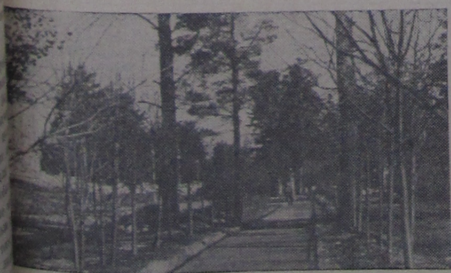
На площадке Лаборатории ядерных проблем. Ранняя весна.

Сейчас продажа молока производится с доставкой на дом, и в газете № 3, во вновь открытой палатке в районе левого берега. В ближайшее время Иваньковский райторг приступит к продаже молока из развозной цистерны. Молоко будет доставляться на отдаленные улицы города, где нет молочных магазинов.