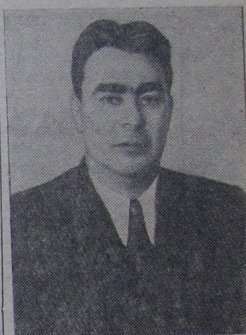
Леонид Ильич Брежнев

Леонид Ильич Брежнев родился в 1906 году в городе Днепродзержинске, Украинской ССР, в семье рабочего-металлурга.