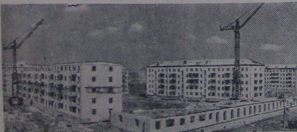
Строители Челябинской области обязались в текущем году ввести в действие 1350 квадратных метров жилой площади, 27 школ, 8 больниц, 30 детских садов, 18 детских яслей. В Металлургическом районе Челябинска за последнее время сооружено большое количество жилых домов, которые образовали новые улицы. На снимке: строительство жилых домов на улице 3-го спутника.