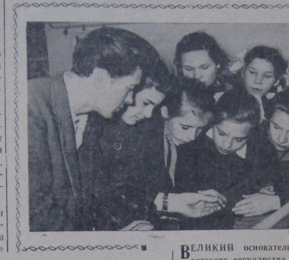
Великий основатель Советского государства В. И. Ленин учил, что молодежи необходимо связывать свое учение с трудом, с борьбой за переустройство промышленности и сельского хозяйства, с борьбой за культуру и просвещение народа.