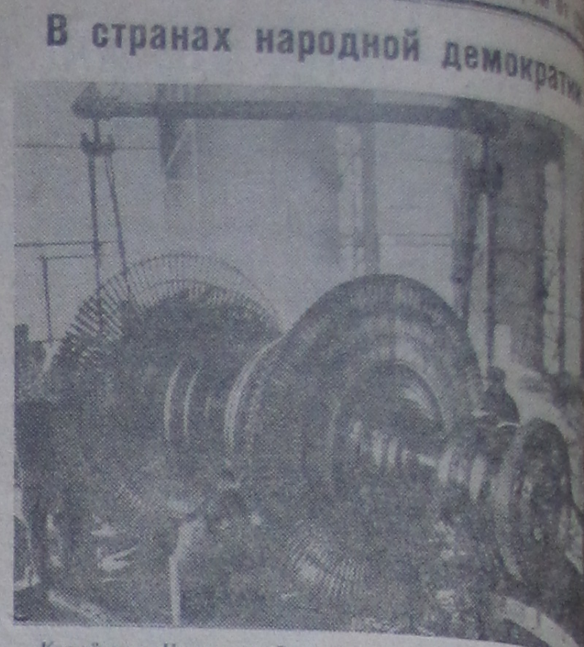
Китайская Народная Республика. На Харбинском заводе генераторов создана первая в стране паровая турбина мощностью 100 тысяч киловатт. На снимке: установка ротора турбины.