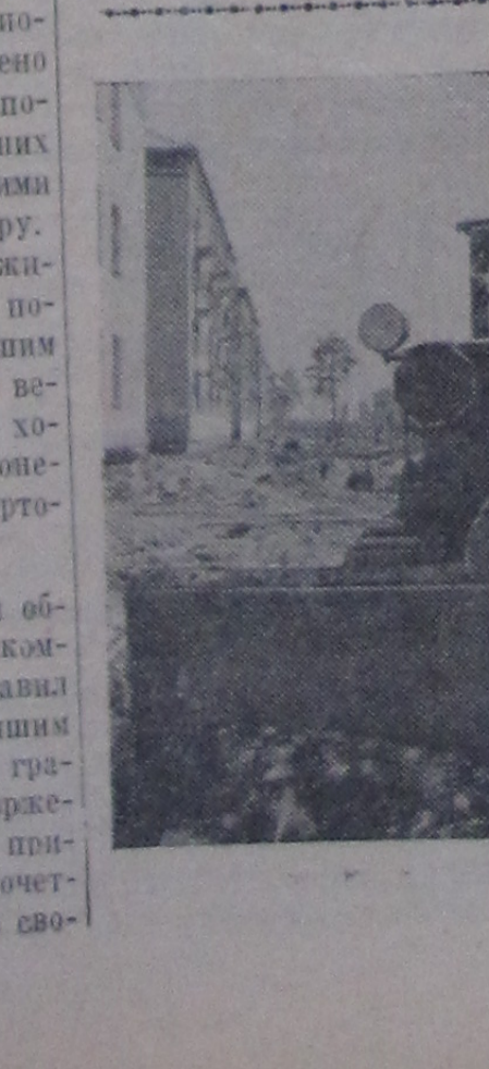
Разравнивание территории на строительной площадке при помощи бульдозера.

В 11 часов дубненские пионеры под звуки торжественного марша направились на стадион. Вместе с дубненскими пионерами сюда пришли и учащиеся Большевожской средней школы № 2. Начался пионерский праздник. Флаг поднимают лучшие пионеры наших школ, начинается торжественная линейка. Рапорт отдали председатели советов дружин Дубненской школы № 3 — Нади Азарова и Большевожской школы — Володя Кутнер. Сегодня пионерам есть о чем рапортовать. Тонны металлолома отгрузили для промышленности пионерские отряды, много было сделано руками ребят в честь ленинского юбилея. Дню рождения пионерской организации были посвящены смотры художественной самодеятельности, выставки и т. д. Четыре концерта художественной самодеятельности дала школа Б. Волги, в смотре самодеятельности она заняла первое место. Руками пионеров этой школы высажено 1500 деревьев и кустарников, построен стадион. Пионеры наших городов шефствуют над детскими садами, собирают макулатуру. Школы перешли на самообслуживание. Тимуровские команды помогают пенсионерам и младшим ребятам, пионеры-инструкторы ведут кружковую работу. Много хорошего, полезного сделали пионеры — об этом-то они и рапортовали на своем празднике.