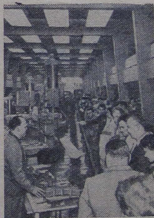
Москва. На промышленной выставке Венгерской Народной Республики.

Художественный кинофильм «Волга—Волга». Начало сеансов в 17, 19, 21 и 22.30.