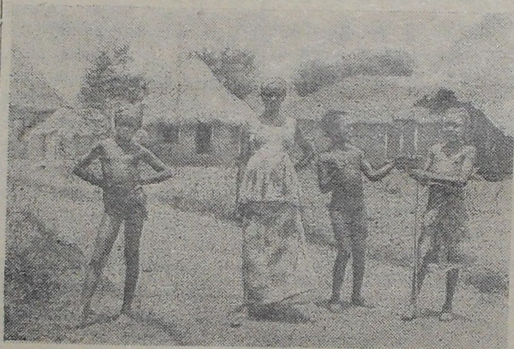
Либерия. В деревне недалеко от столицы страны города Монровия.