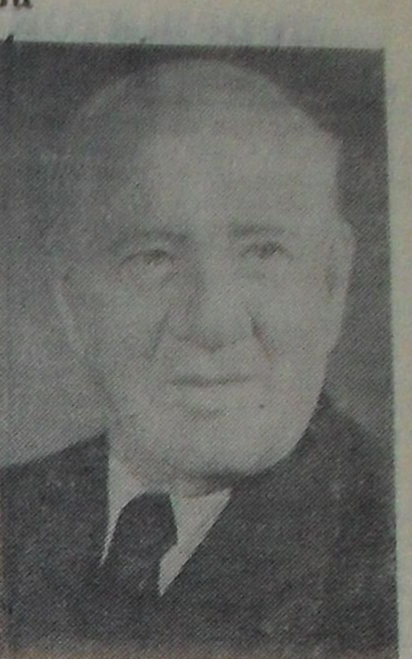
На снимках (слева направо): поэт З. Б. МЕЖЕЛАЙТИС, художник В. А. ФАВОРСКИЙ, писатель Н. И. ЧУКОВСКИЙ.