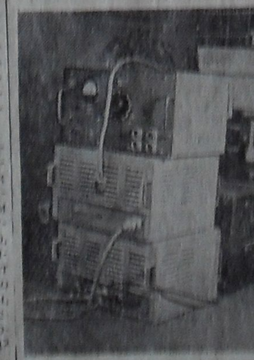
Было много разговоров. Чтоб создать бюро приборов. Но, понауря свесив «хоботы», без работы дремлют «рыботы».