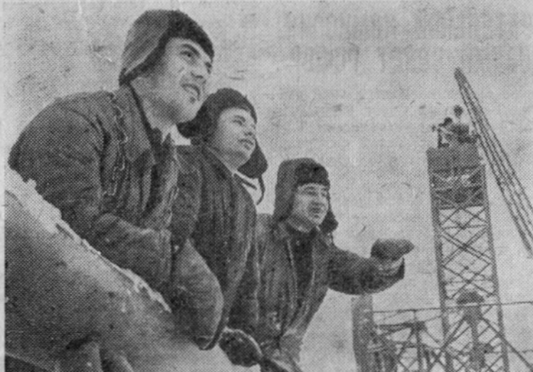
КАЛИНИНСКАЯ ОБЛАСТЬ. В 120 километрах от столицы на берегу Московского моря строится крупнейшая в мире Конаковская теплоэлектростанция мощностью 2 миллиона 500 тысяч

киловатт. Она будет снабжать электроэнергией промышленные предприятия Москвы и Московской области, позволит электрифицировать ряд районов Калининской области и улучшить снабжение электроэнергией железнодорожную линию Москва—Ленинград. Сейчас строители закончили подготовительные работы и приступают к строительству основных сооружений.