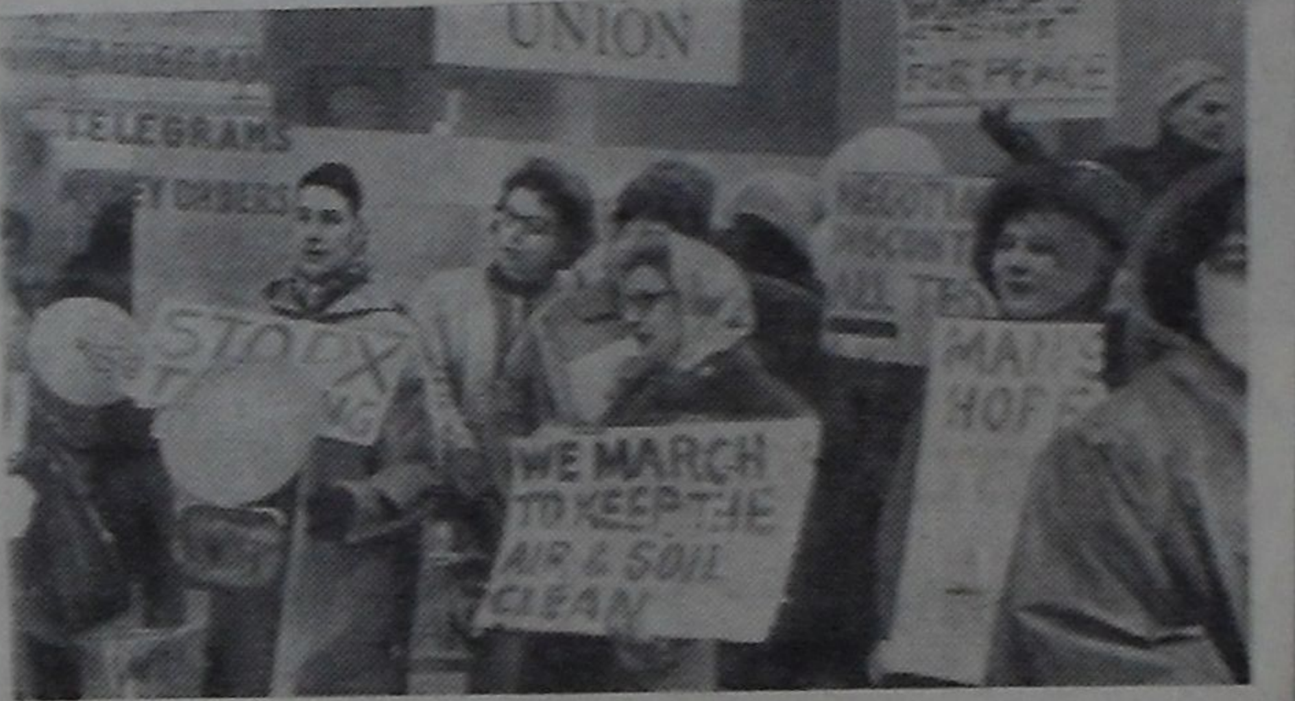
Возобновление подземных ядерных испытаний в Соединенных Штатах Америки вызывает возмущение мировой общественности. Протестуют многие тысячи простых американцев. Недавно в Нью-Йорке состоялась демонстрация женщин, выступающих против гоним вооружений, за прекращение атомных испытаний. Демонстранты отправили телеграммы протеста в Вашингтон на имя президента.

Вот почему Советский Союз, при поддержке всех миролюбивых сил, решительно выступает против этих опасных планов. Я. МАЗОР. (ТАСС)