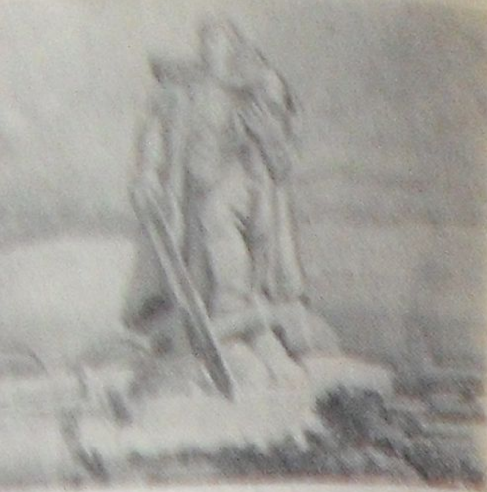
В свободное время работает над созданием новой модели сооружения на Поклонном холме...