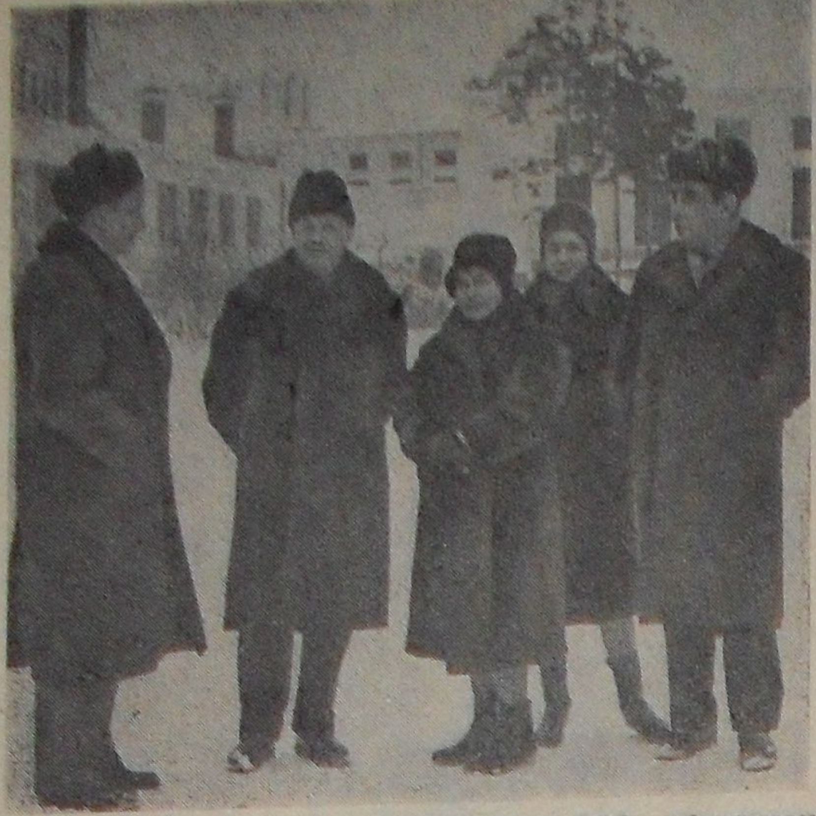
На днях по приглашению парторганизации ЛВЭ, обслуживающей агитпункт, расположенный в школе № 4, Дубну посетила группа старейших членов КПСС, лично знавших В. И. Ленина. Они осмотрели Лабораторию высоких энергий, а вечером встретились на агитпункте с избирателями. Беседа была задушевной, интересной. На снимке: старейшие члены Коммунистической партии на экскурсии в ЛВЭ.

В магазине № 9 хозяйственных товаров на Октябрьской улице, имеются в продаже хозяйственные. Редактор А. М. ЛЕОНОВ. В магазине № 9 хозяйственных товаров на Октябрьской улице, имеются в продаже хозяйственные. Редактор А. М. ЛЕОНОВ. В магазине № 9 хозяйственных товаров на Октябрьской улице, имеются в продаже хозяйственные. Редактор А. М. ЛЕОНОВ.