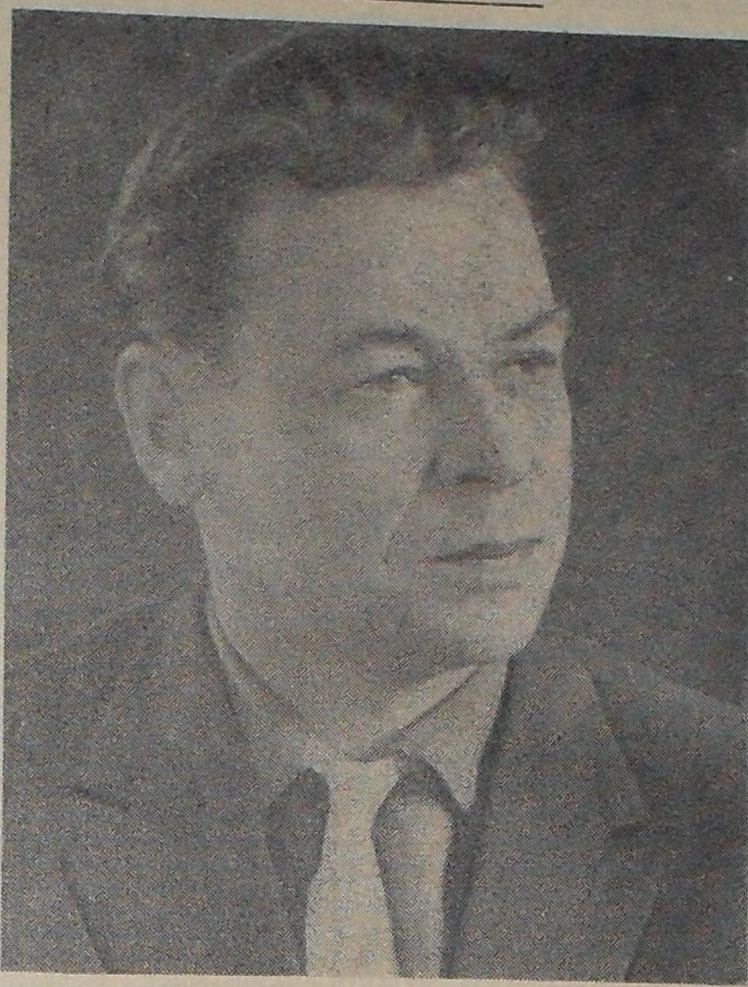
На снимках (слева направо):