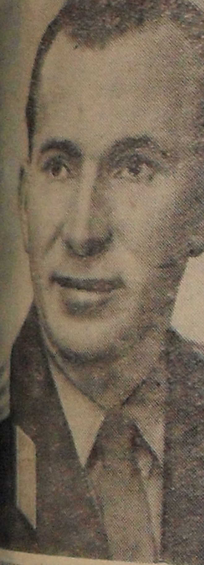
Космонавт (слева) и второй пилот корабля «Восход-2» Черединычев.

Вчера Москва торжественно поздравляет учеников-космонавтов, выполнивших новые задания на предприятиях и в учреждениях, посвященные юбилею космоса, благополучному вы-