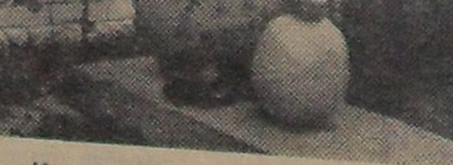
Купленный на рынке в Ханое грейпфрут весом около 5 килограммов.

представляем себе школьный глобус, вспоминаем маршрут путешествия. Ну и занесло же нас! На перекрестке стройная, молодая девушка-милиционер в пробковом шлеме регулирует движение. Улицы заполнены неторопливыми прохожими. Мелодично стучат по асфальту деревянные подошвы легкой летней обуви. Воздух напоен незнакомым ароматом юга, еще раз в голову приходит мысль «Ну и занесло же нас». Возвращаемся в гостиницу. Моется холодной водой (горячая бывает не всегда). Обсуждаем первое впечатление, и вдруг по стене с огромной скоростью пробегает ящерица величиной с карандаш. Нужно сказать, что на нас это произвело сильное впечатление. Во всяком случае без посторонней помощи мы уяснили себе назначение полога над кроватью. Впоследствии мы узнали, что это безобидное пресмы-