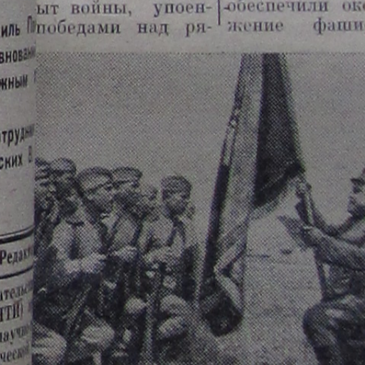
Воины у боевого знамени дающей победы.

Вспомним те дни, когда в небе над Москвой и Ленинградом воевали наши истребители. Вспомним те дни, когда в небе над Москвой и Ленинградом воевали наши истребители. Вспомним те дни, когда в небе над Москвой и Ленинградом воевали наши истребители.