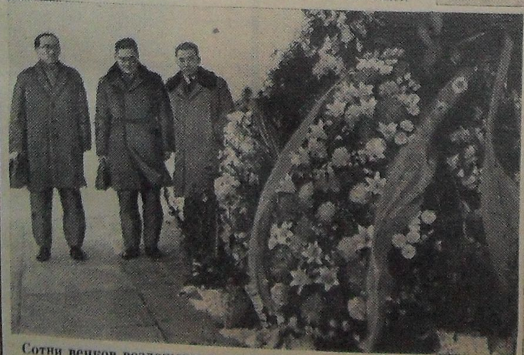
Сотни венков возложены к подножию памятника воинам-защитникам Москвы, установленного у г. Яхромы. На снимке: монгольская делегация — члены Ученого совета ОИЯИ, члены Комитета Полномочных Представителей ОИЯИ, ученые, работающие в лабораториях Института возлагают венок к подножию памятника.

Лучшие исполнители и коллективы награждаются грамотами оргкомитета, горкома КПСС и исполкома горсовета, дипломами.