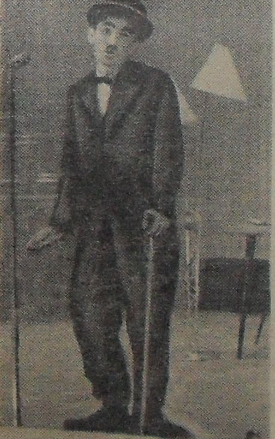
«И вот уж Ивановна теперь жена Петрова, Петрова стала Шламбер, а та... живет со мной!... «Я вам скажу, ей-богу, здесь недостатков много, но вы меня поймите — ведь мне еще здесь жить». Чаплин в Дубне — В. Денисов.