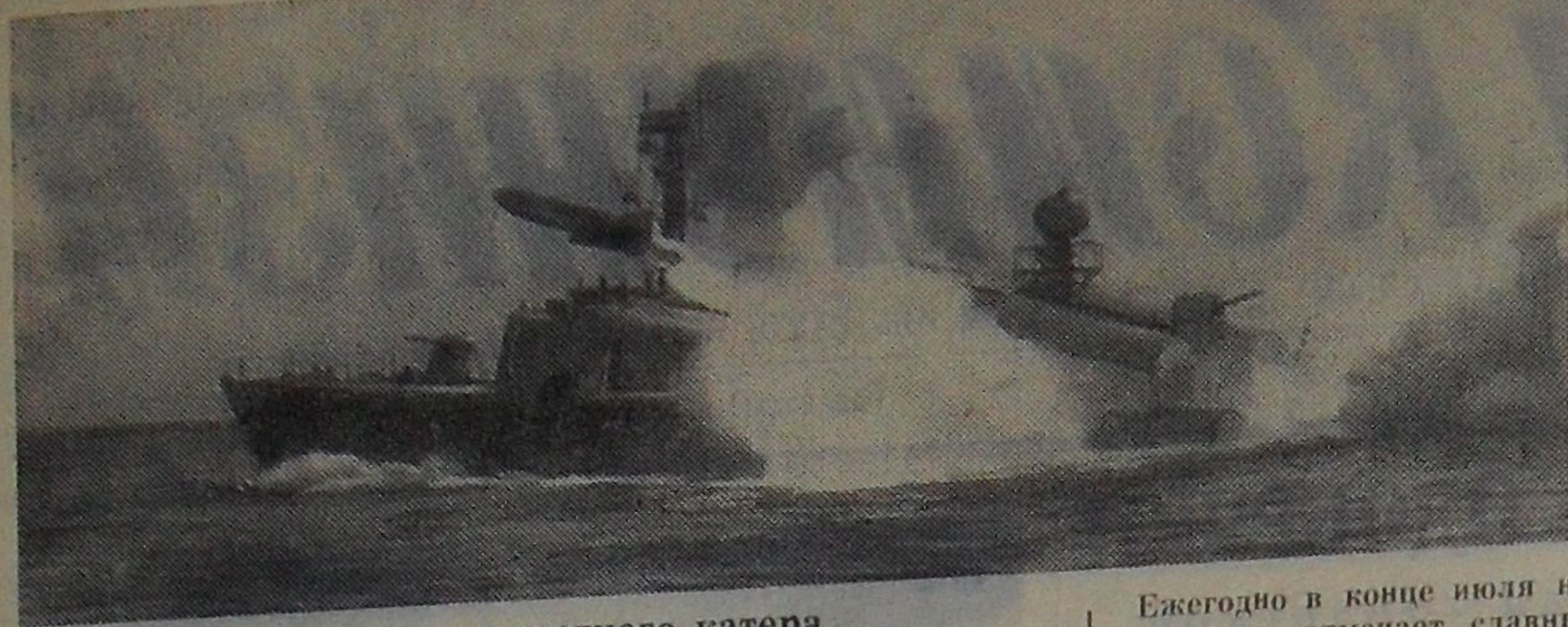
Пуск ракеты с ракетного катера.