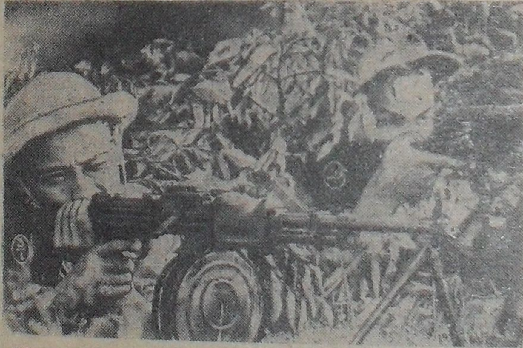
Южный Вьетнам. Молодые бойцы Армии освобождения ведут огонь по американским агрессорам.