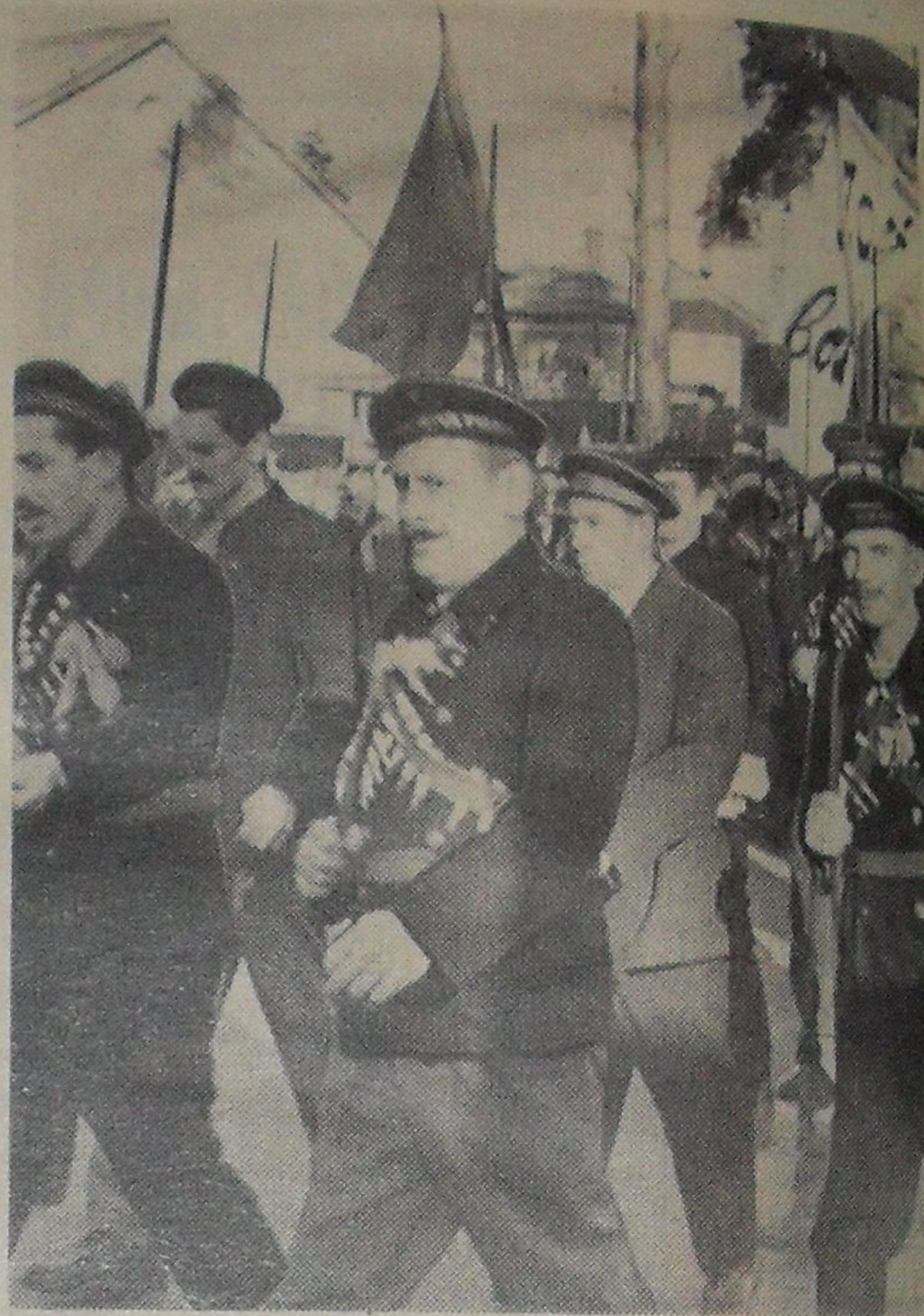
В колонне, посвященной 1917 году.