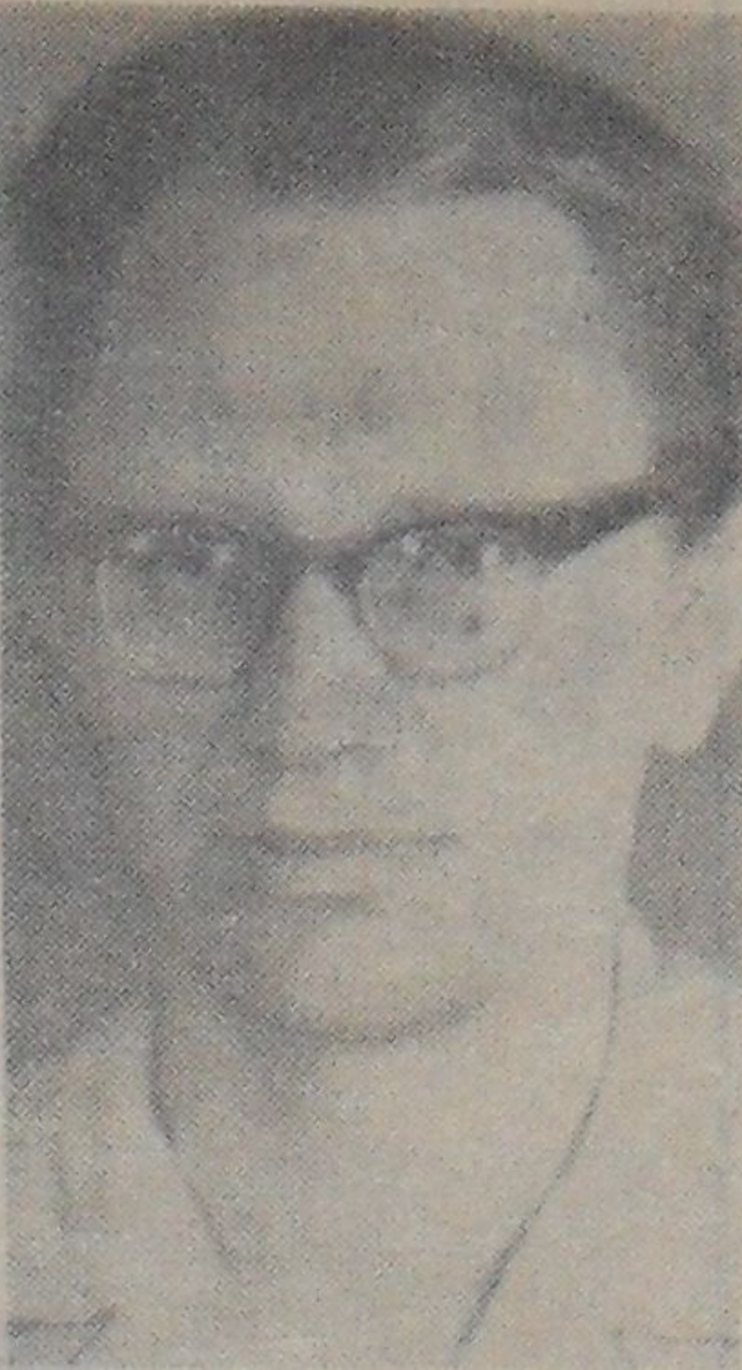
ма-спектрометров. В 1964 году впервые в ОИИИ им была запущена установка для измерения времен жизни возбужденных ядерных состояний

Р. БАБАДЖАНОВ, В. КАЛИНИКОВ.