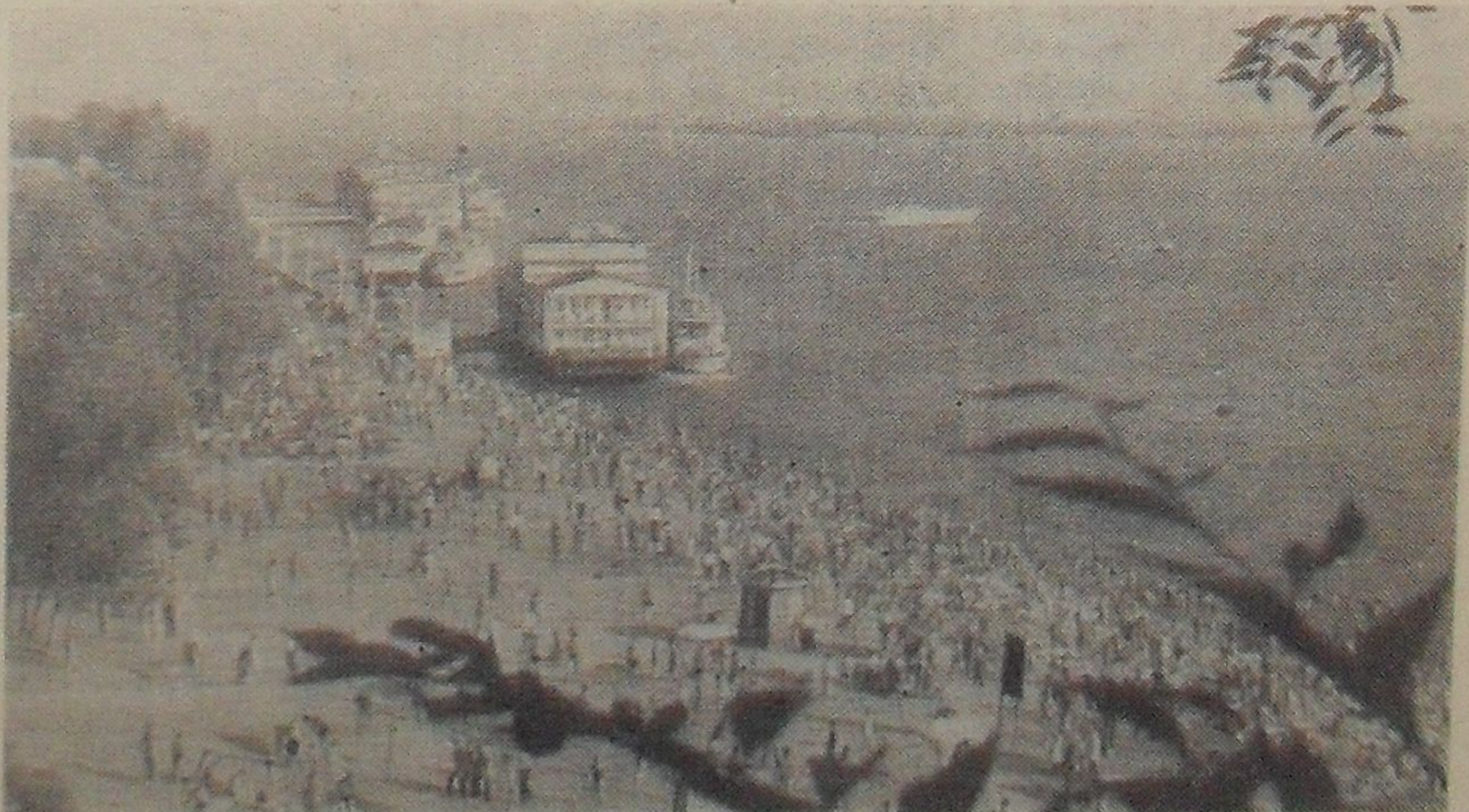
Хабаровск — первая остановка на нашем пути. Это берег Амура, а не Черного моря.