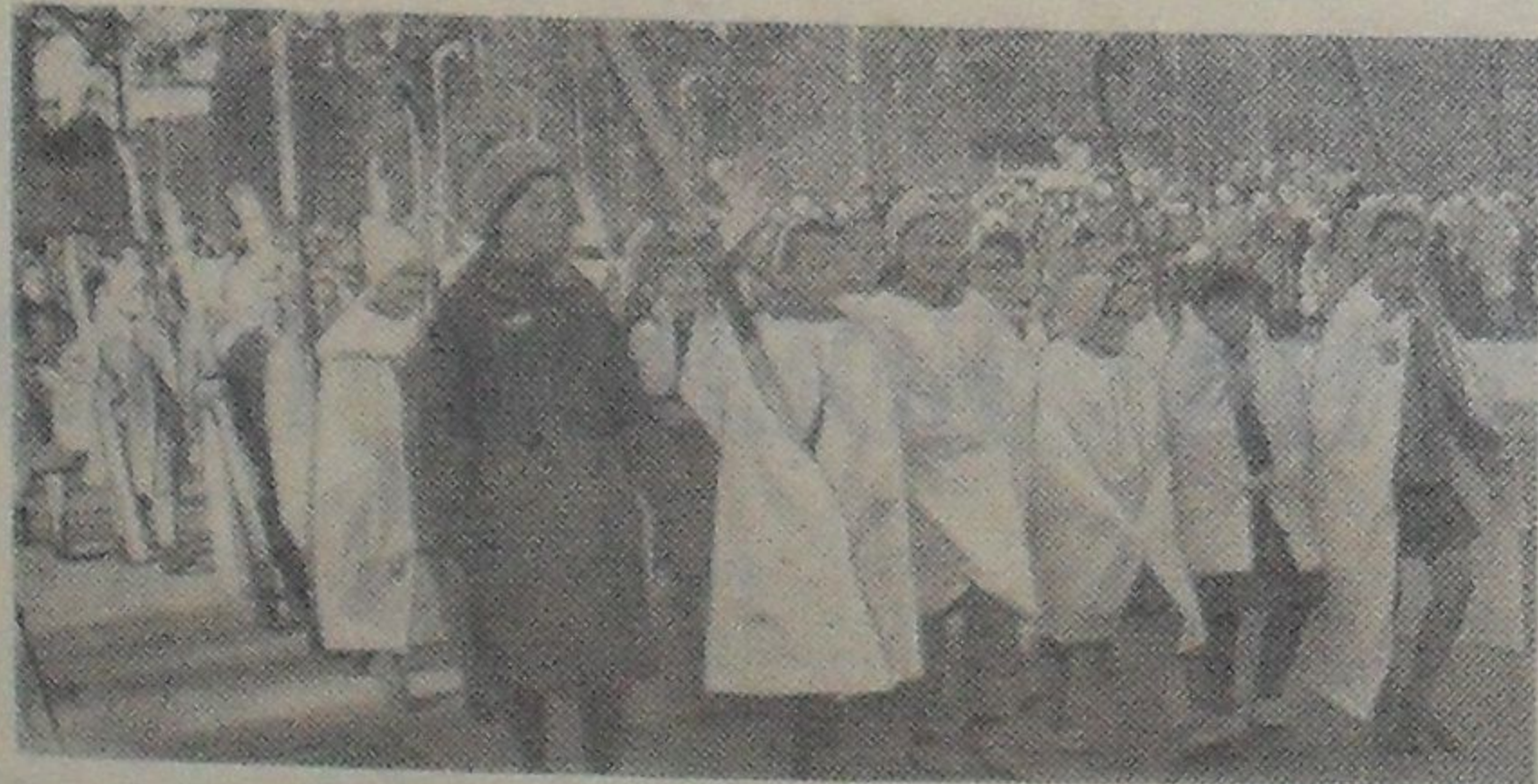
Школьники (в костюмах десантников).