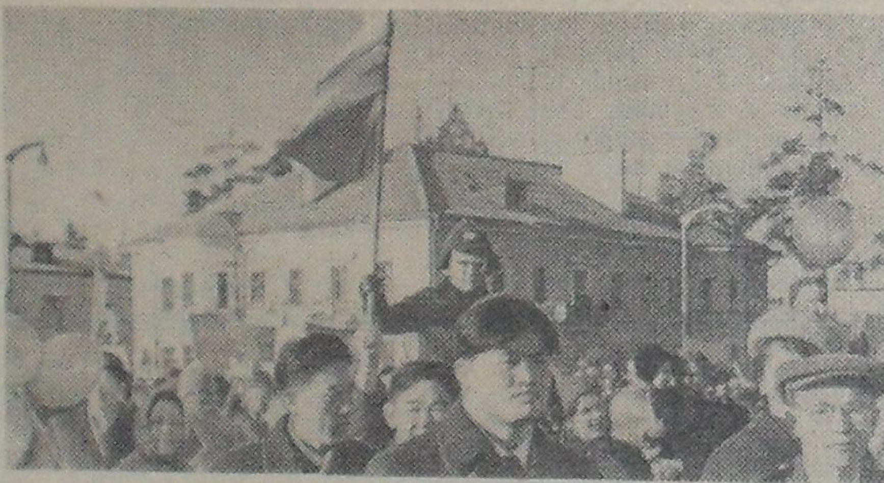
В колонне Объединенного института