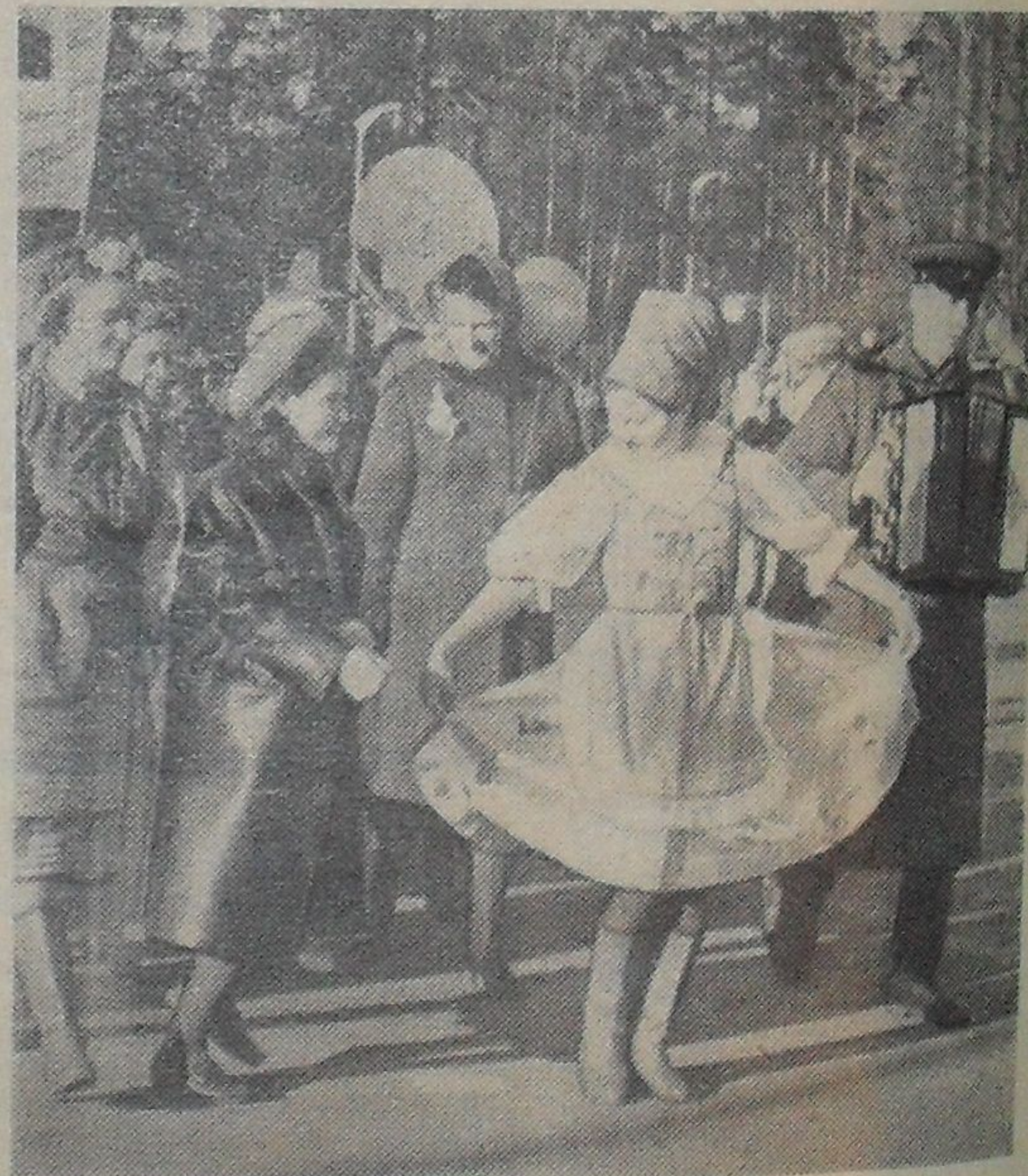
Особенно весело было в колонне оorsa.