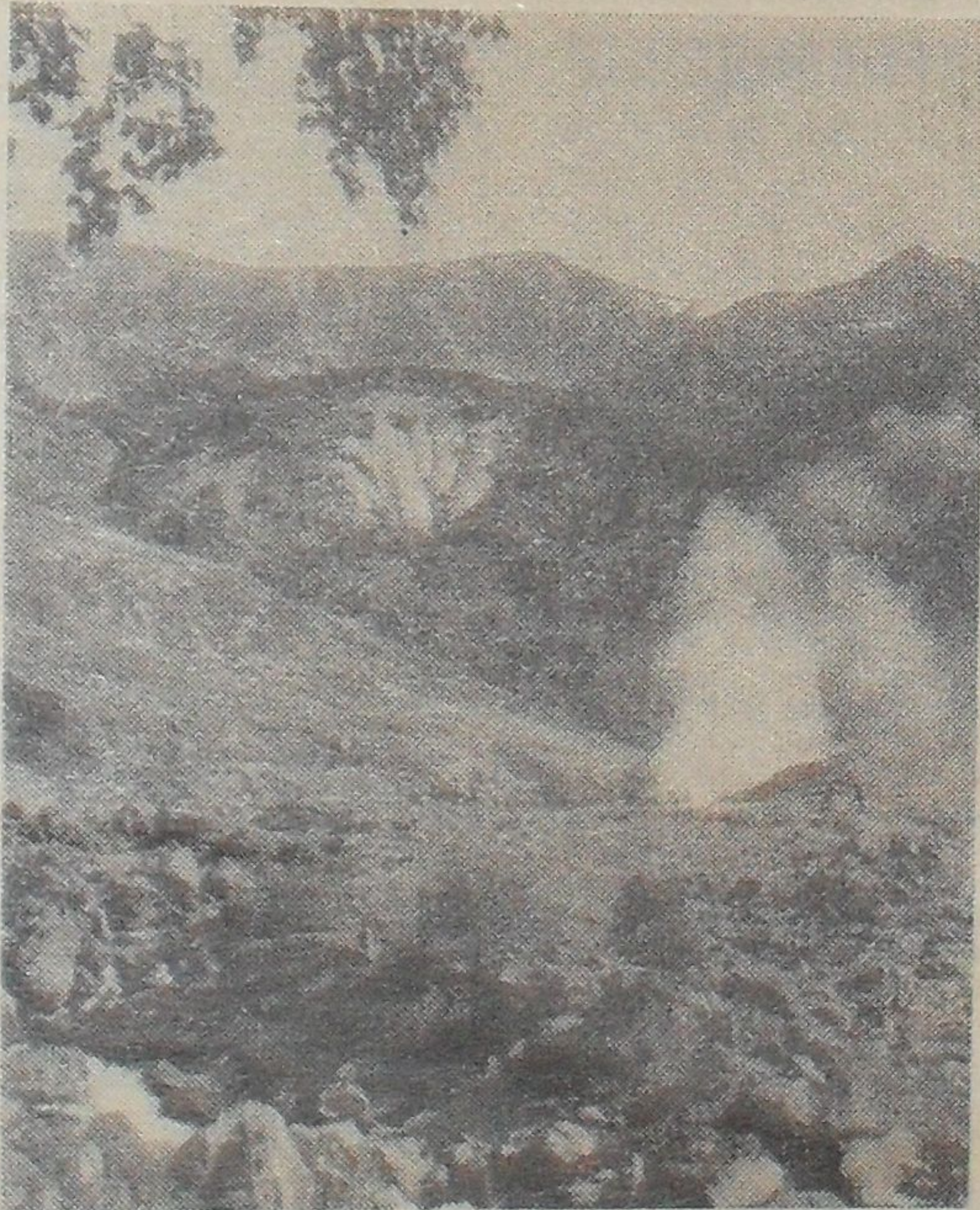
Общий вид Долины Гейзеров.