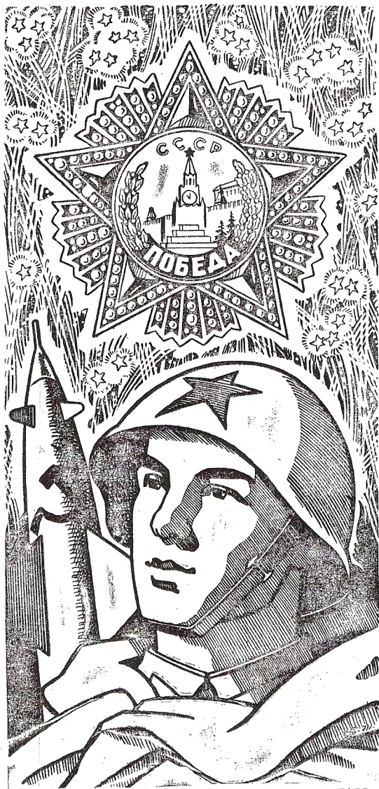
Рисунок С. Григорьева.

По итогам смотра на лучшую постановку работы в области изобретательства, рационализации и патентного дела среди родственных предприятий нашей отрасли коллективу Объединенного института ядерных исследований присуждено призовое третье место.