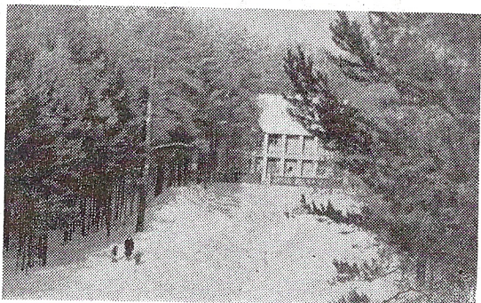
ОДИН ИЗ УГОЛКОВ НАШЕГО ГОРОДА

А. ЯКОВЛЕВ, член совета молодых ученых в ОНЯИ.