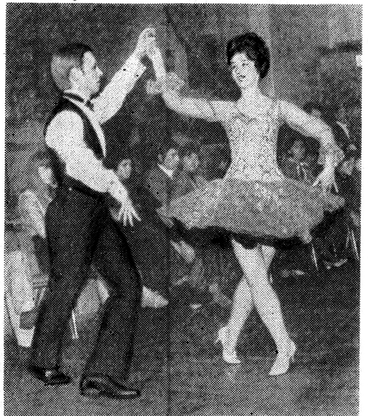
Танцуют почти все, однако не часто приходится видеть, чтобы юноша или девушка делали это правильно и красиво. А между тем в процессе эстетического воспитания молодежи культура танцев составляет важный элемент. Танец в хорошем исполнении — это искусство, и как любое другое оно приносит много радости. В познании искусства балетного танца на помощь молодежи города приходит Дом культуры. Под руководством опытных педагогов молодежь учится красиво танцевать. Хочется пожелать, чтобы эту школу прошло больше юношей и девушек.