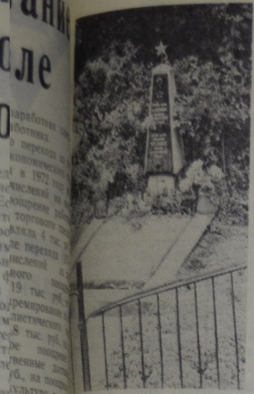
Могила советского солдата, отдавшего жизнь за освобождение Праги.