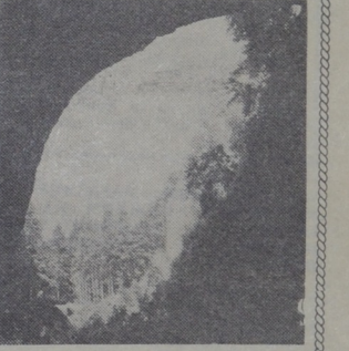
Пещеры Мацоха. Здесь выходит на поверхность подземная река Пунква.