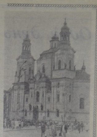
Костел св. Николая на Староместской площади. Построен в стиле барокко.

Довольны ли мы? Спокойного отдыха в общем поимани этого слова — не было. Мы увидели очень много нового и интересного, познакомились со старыми людьми, с жизнью братских народов. А чтобы крепить дружбу, очень важно ближе знать и понимать друг друга.