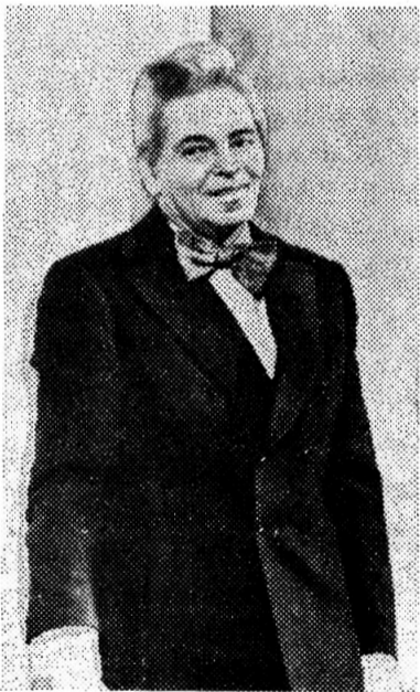
НА СЦЕНЕ — АРКАДИЙ РАЙКИН