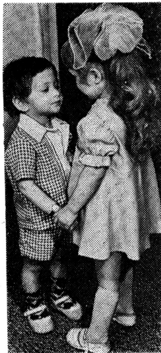
У БРАТИШКИ ДЕНЬ РОЖДЕНИЯ