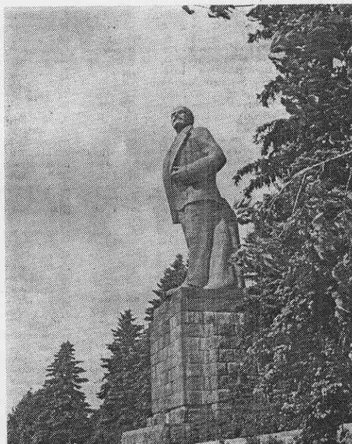
21 апреля у монумента В. И. Ленина состоится городской торжественный митинг, посвященный 119-й годовщине со дня рождения основателя Советского государства.

Начало в 17.30. Отправление автобусов на митинг с пл. Мира и Космонавтов в 16.55.