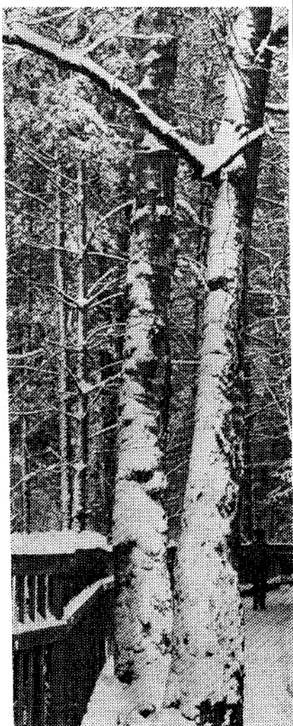
СНЕЖНЫЙ ФЕВРАЛЬ

Недавно нам пришлось перенести серьезные операции, о которых все полутвердительно осведомлялись: «В Москве?». А узнав, что в Дубне, собеседник тактично переводил разговор на другую тему, оценивая нашу храбрость и, видимо, жалея нас.