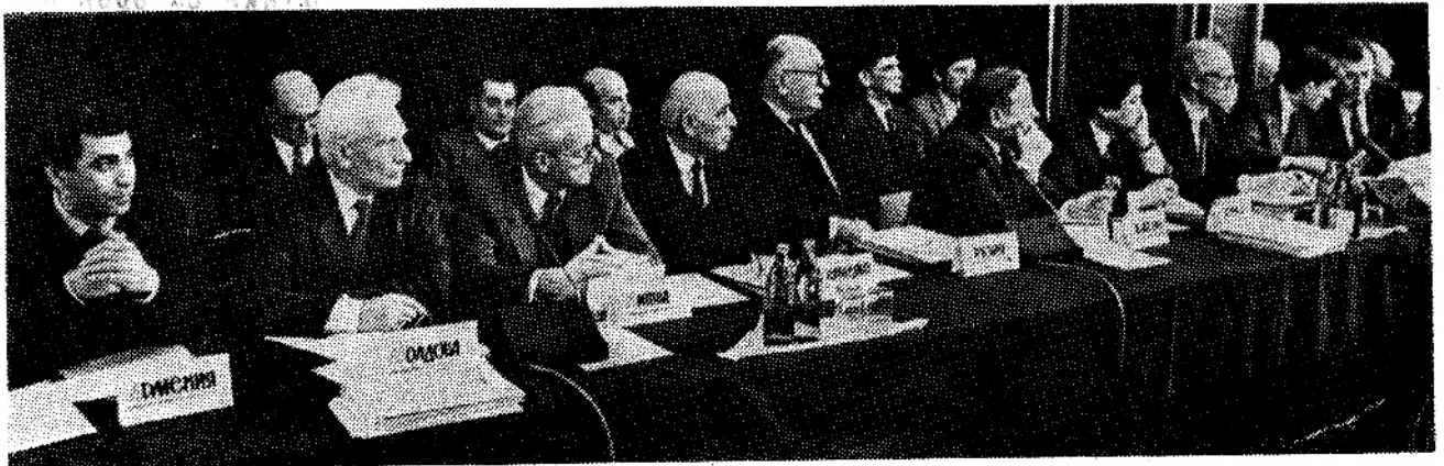
На снимке: представители суверенных республик — на декабрьском совещании КПП.