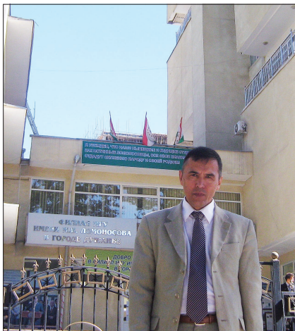
Автор статьи у здания филиала МГУ имени М. В. Ломоносова в Душанбе.

которые могут играть важную роль в функциональных свойствах зрительного пигмента. Метод же МД моделирования позволяет описать динамику конформационного состояния, например хромофора и его взаимодействия с окружающими аминокислотными остатками или динамику других, цитоплазматического и внутридисксового доменов молекулы. Одним словом, методы МД моделирования позволяют измерять и оценивать «дыхание» белков, находить их структурные особенности в условиях физиологического функционирования, просчитывать возможные химические реакции и мутационные превращения, представляющие интерес с точки зрения фармакологии и разработки новых лекарств для биомедицинских приложений. Важно отметить, что в этом