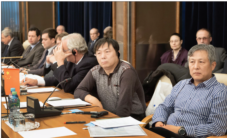
В работе сессии КПП ОИЯИ впервые за многие годы в качестве наблюдателя приняла участие делегация из Китая.

Дирекцией были задействованы все доступные ресурсы бюджета для наиболее полного материального обеспечения развития базовых установок. Необходимо сказать, что при таких интенсивных темпах развития всегда ощущается нехватка средств, тем не менее дирекцией были приняты непростые решения, касающиеся роста фонда оплаты труда и расходов на текущий ремонт зданий и сооружений Института.