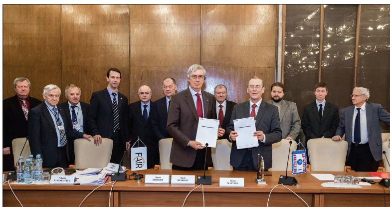
Подписание соглашения о сотрудничестве FAIR (Дармштадт, Германия) и ОИЯИ.

– Мы начали работать в 90-е годы, вклад огромный. Группы из ОИЯИ имели основополагающее значение для развития этого проекта. В 1994–1995 годах, когда началось строительство, сотрудничество было очень тесным, и оно продолжается до сегодняшних дней. Были группы, которые занимались калориметрией, группы, которые работали с мюонными детекторами, а также те, кто создавал трековый детектор и детектор переходного излучения. Работы, которые шли во время строительства, были связаны с большим количеством технических проблем, с изготовлением магнитов. Все это время