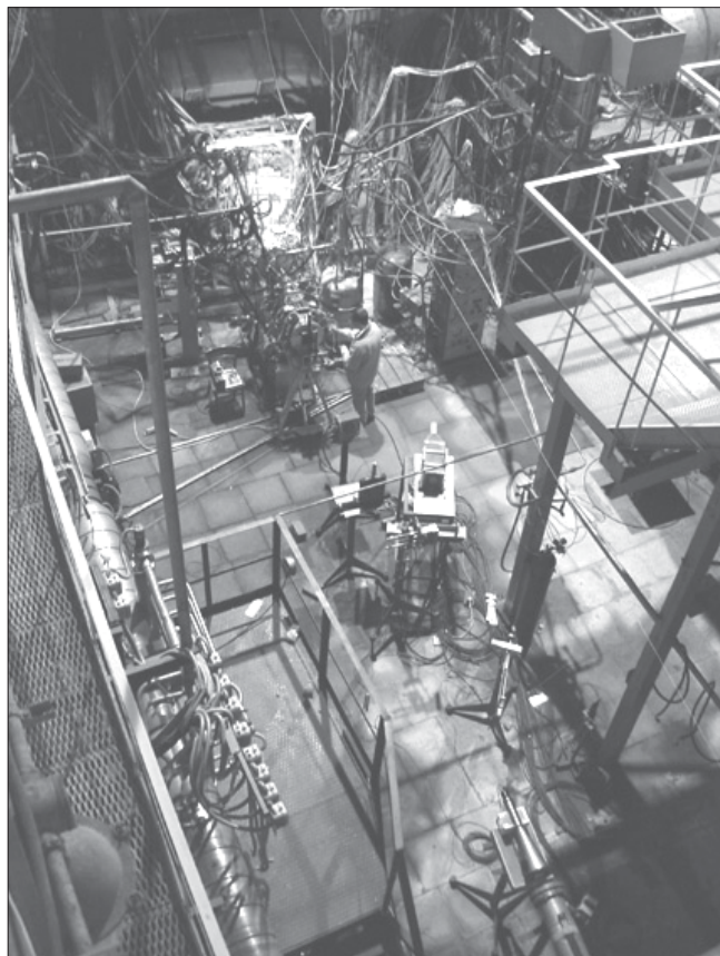
Установка СВД-2, где проводились испытания созданной ячейки-демонстратора.

Эксперимент в Протвино был проведен при активном участии сотрудников ЛФВЭ ОИЯИ, НИИЯФ МГУ, ИФВЭ и GSI. В 2009 году планируется создание следующих, еще более сложных элементов микростриповых трековых систем и их испытания на пучках релятивистских протонов как на