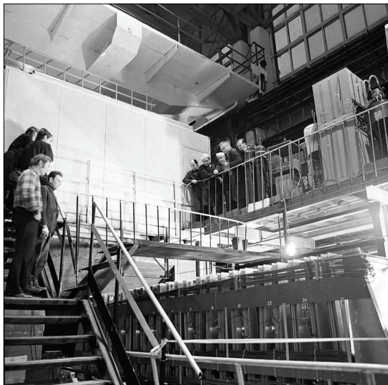
Магнитный искровой спектрометр в ИФВЭ, 1973 год.

Когда руководство ИФВЭ узнало, что физики ОИЯИ хотят создавать большой магнитный искровой спектрометр для проведения экспериментов на У-70, то они проинформировали нас, что ИФВЭ приобрел электромагнит СП-130, имеющий рабочий объем 80х150х600 куб. см, и скоро будет начат его монтаж в ИФВЭ. На базе этого электромагнита физики ИТЭФ под руководством В. В. Владимирского хотят создать свой магнитный искровой спектрометр. Серпуховчане предложили нам объединиться с ИТЭФ и создать единый спектрометр. Мы были очень рады принять это предложение, так как горели желанием ускорить начало исследований на самом крупном ускорителе в мире. Однако как только Владимирский узнал об этом,