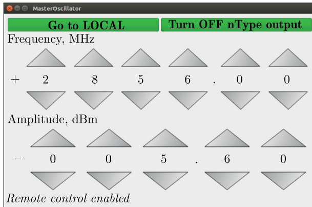
Рис. 1. Клиентское приложение для задающего генератора АКПП-7SG384