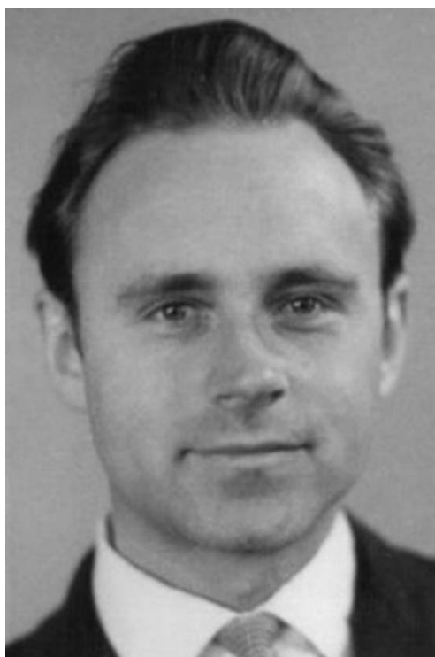
Фото 5. И. Н. Гончаров