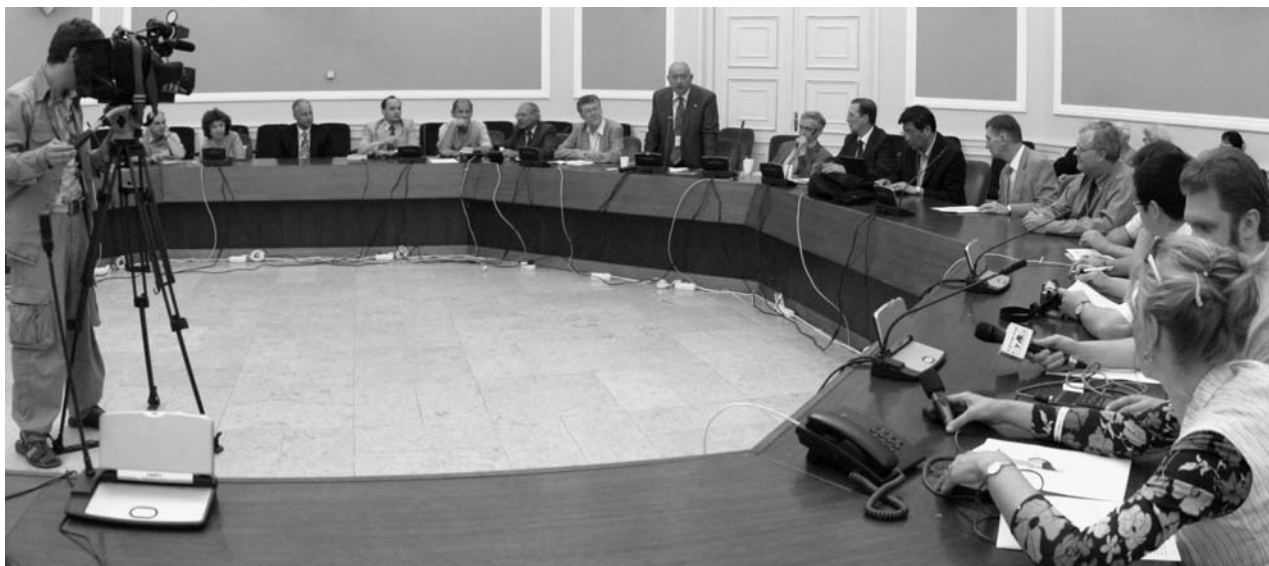
Москва, 27 июля. Пресс-конференция, посвященная открытию XXXIII Международной конференции по физике высоких энергий (ICHEP'06)