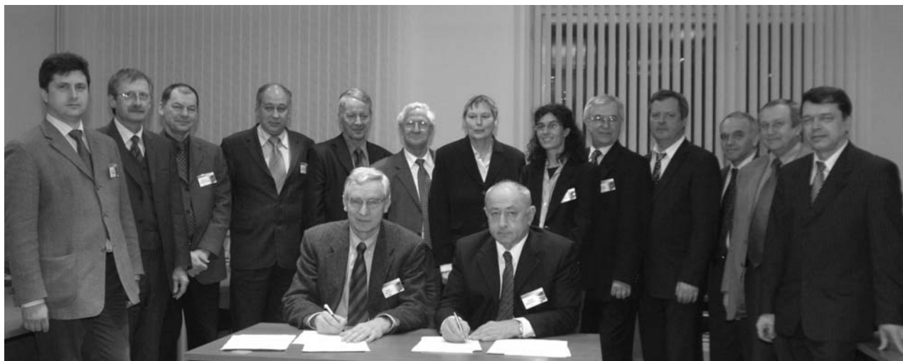
Дубна, 20 февраля. Участники 16-го заседания Координационного комитета по сотрудничеству ВМБФ–ОИЯИ. Подписание протокола о сотрудничестве на 2006 г.