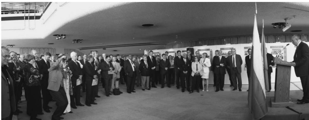
Женева (Швейцария), 25–28 апреля. Выставка ЦЕРН–ОИЯИ «Наука сближает народы»