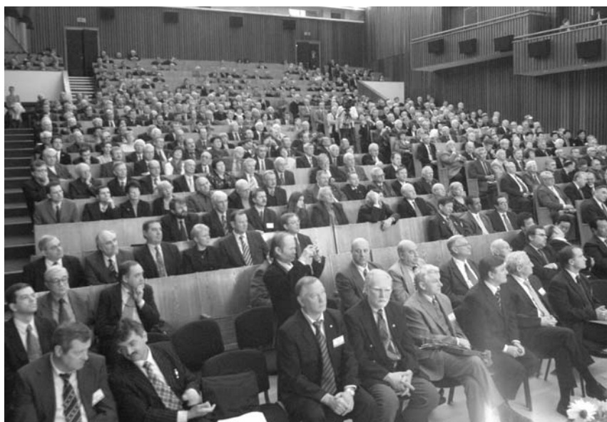
Дубна, 26 марта. Торжественное заседание Комитета полномочных представителей и Ученого совета ОИЯИ, посвященное 50-летию ОИЯИ