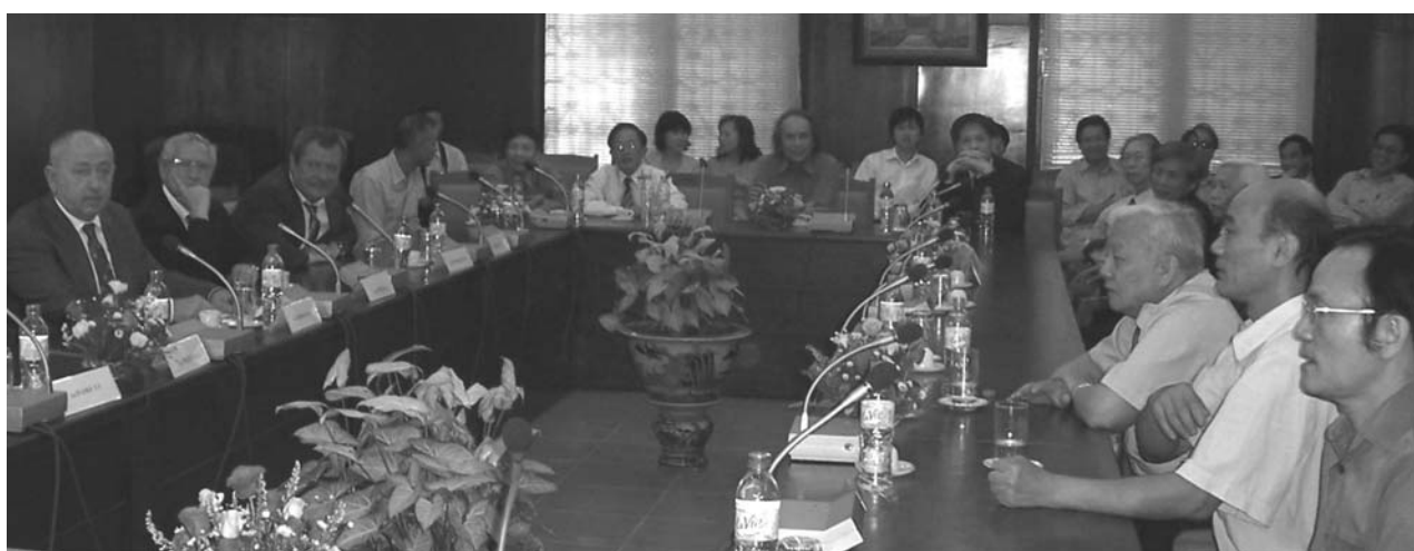
Ханой (Вьетнам), 6 ноября. Торжественная встреча, посвященная 50-летию Объединенного института ядерных исследований