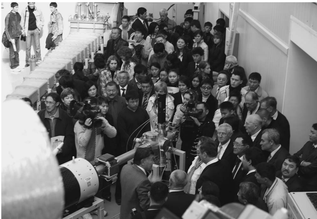
Астана (Казахстан), 21 сентября. Официальное открытие Междисциплинарного научно-исследовательского комплекса на базе циклотрона тяжелых ионов ДЦ-60 при Евразийском университете им. Л. Н. Гумилева