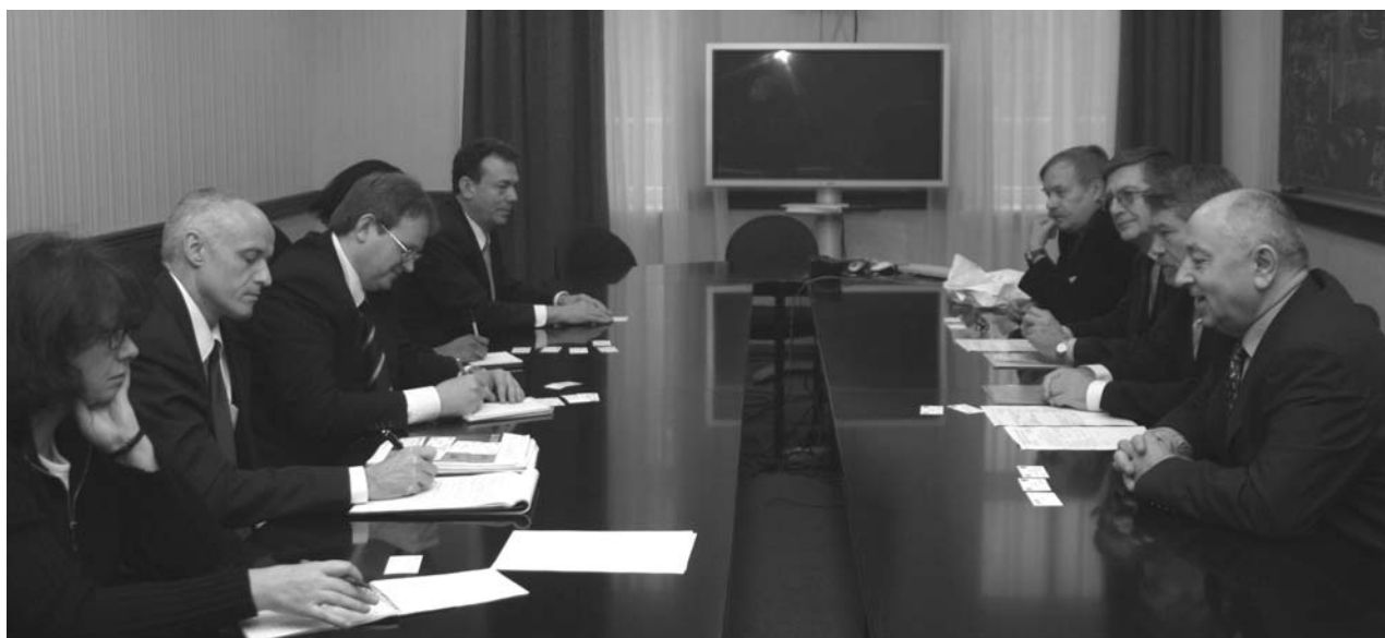
Дубна, 4 декабря. Делегация Министерства энергетики США в ОИЯИ