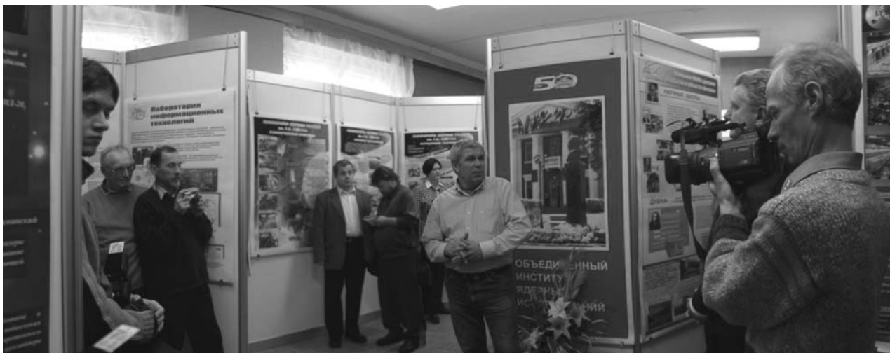
Дубна, Музей истории науки и техники ОИЯИ, 28 марта. Открытие выставки «50-летие ОИЯИ. Этапы развития и важнейшие научные достижения»