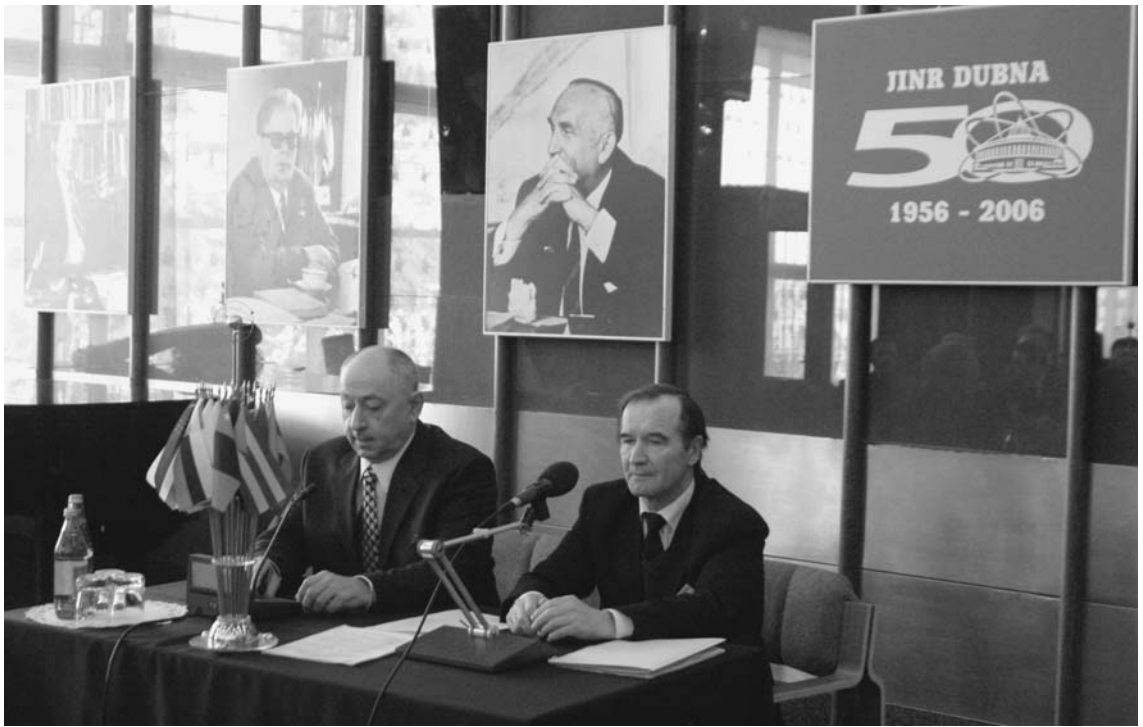
Дубна, 25 марта. Вручение поздравительных адресов, памятных подарков и награждение сотрудников ОИЯИ в связи с 50-летием Института